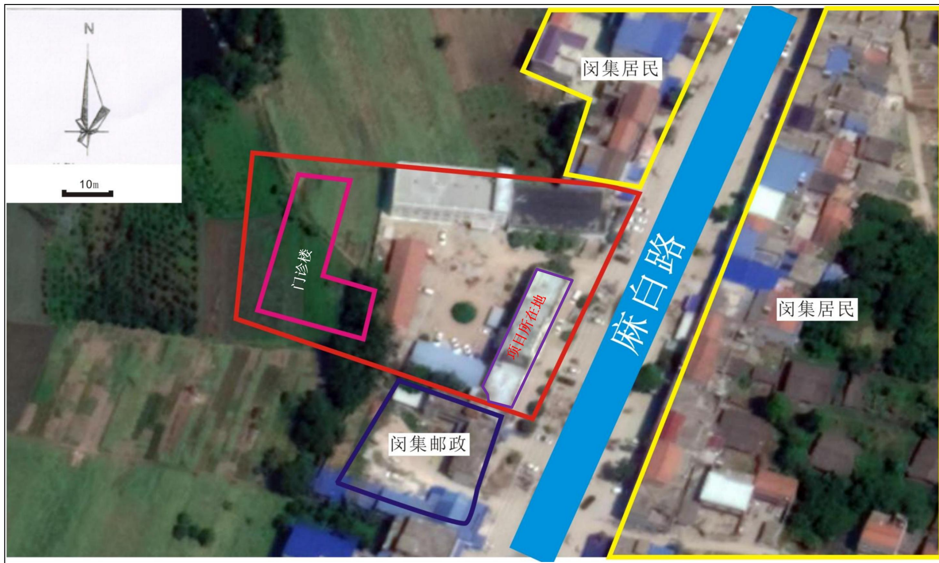
附图 2 项目周边关系示意图