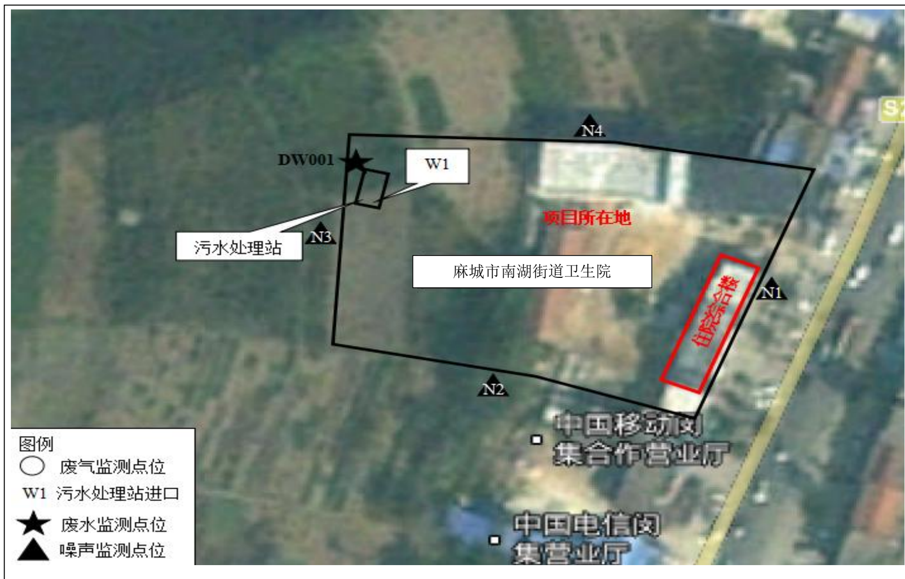
附图 4 项目监测点位图